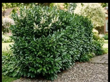
Kirschlorbeer ( Prunus laurocerasus )