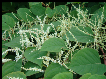
Japanischer Staudenknöterich ( Reynoutria japonica )