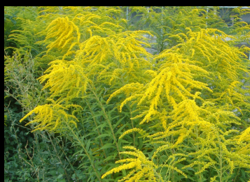
Kanadische Goldrute ( Solidago canadensis )