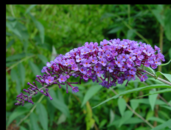
Schmetterlingsstrauch, Sommerlieder ( Buddleja davidii )