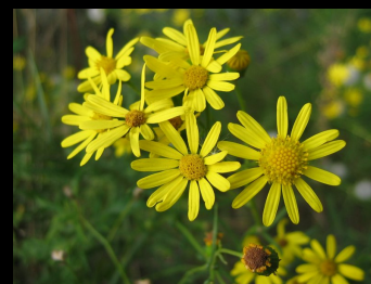
Schmalblättriges Greiskraut ( Senecio inaequidens )